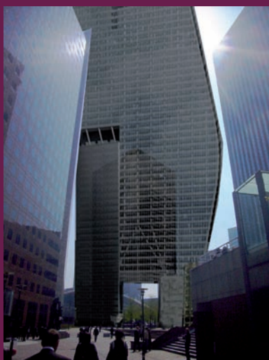
APRÈS la Tour Phare

La perspective rue des Lilas d'Espagne / Escalier Renaissance / Esplanade Mona Lisa sera bouchée par l'énorme masse de la façade nord.