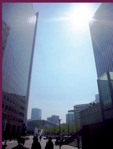
AVANT la Tour Phare

→ Cadre de vie : il faut savoir que si le terrain de la Tour Phare appartient à Puteaux, l'essentiel des nuisances et de l'impact concernent Courbevoie, notamment le quartier Faubourg de l'Arche. Les usagers de la Défense qui empruntent quotidiennement la passerelle « Dalle Carpeaux », attendue pendant 10 ans et mise en service depuis seulement 2 ans, devront faire un détour.