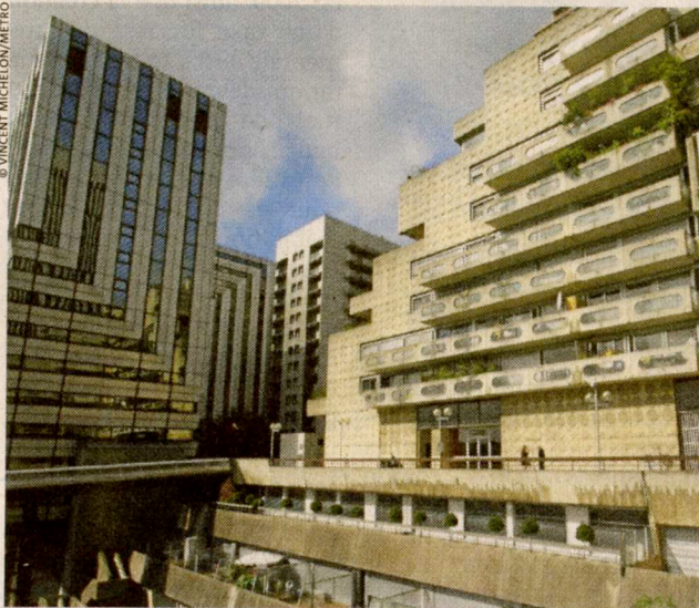
La résidence des Damiers devrait céder la place à une tour.